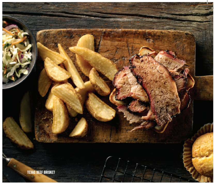
TEXAS BEEF BRISKET

Norwegian salmon grilled, glazed and caramelized with pineapple glaze