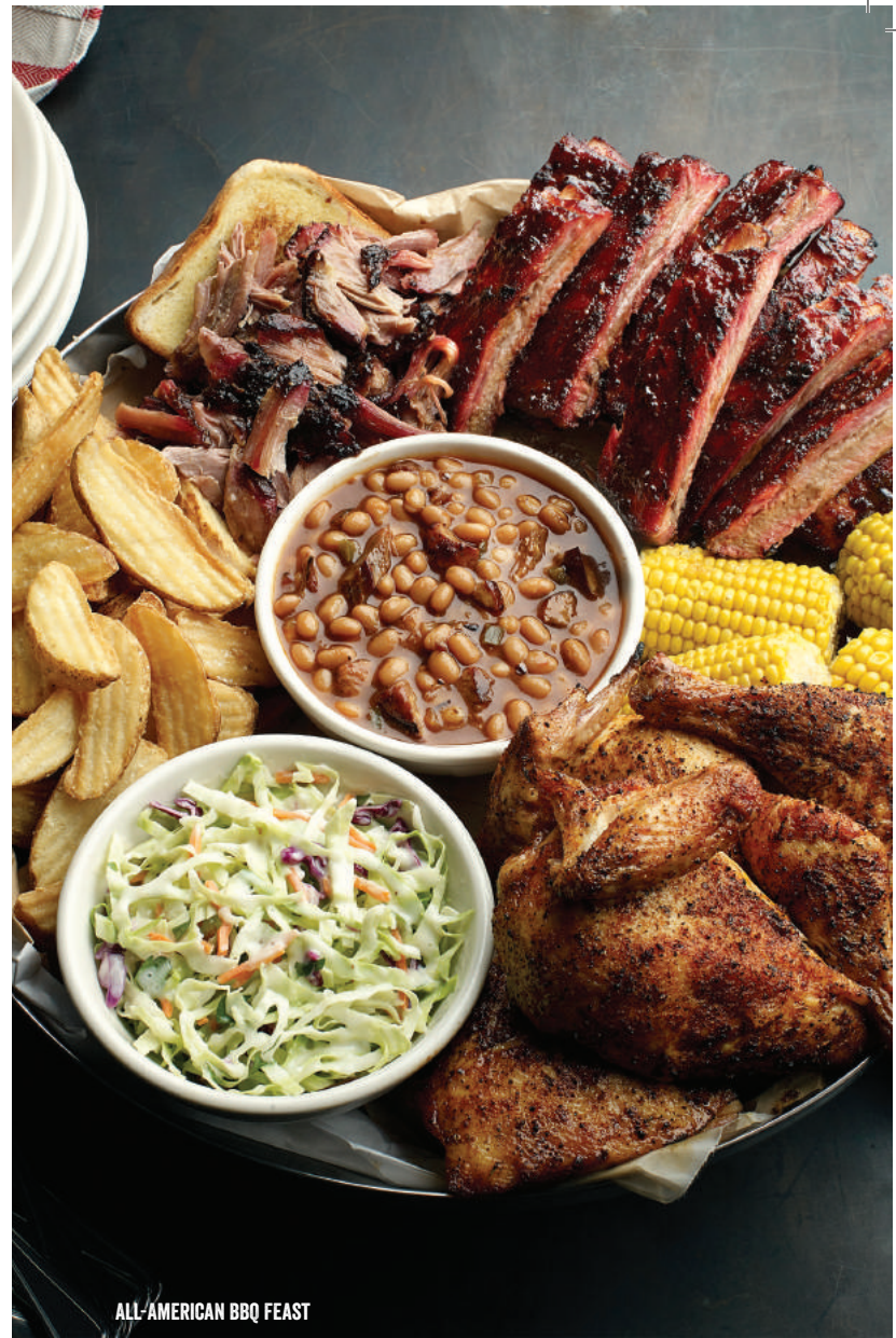
ALL-AMERICAN BBQ FEAST

Our Famous Fried chicken seasoned and fried to order, served with Honey Buffalo or Dave's Revenge & Honey sauce or White BBQ sauce