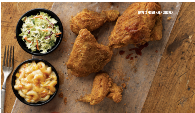
DAVE'S FRIED HALF CHICKEN