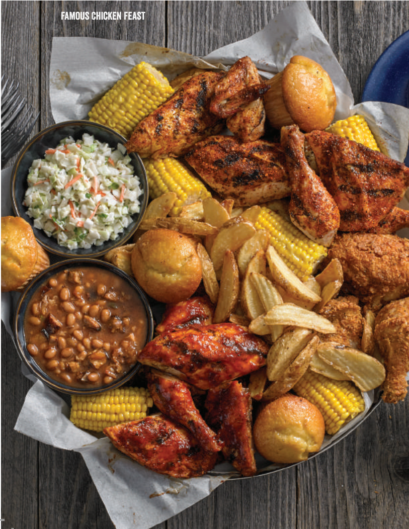
FAMOUS CHICKEN FEAST