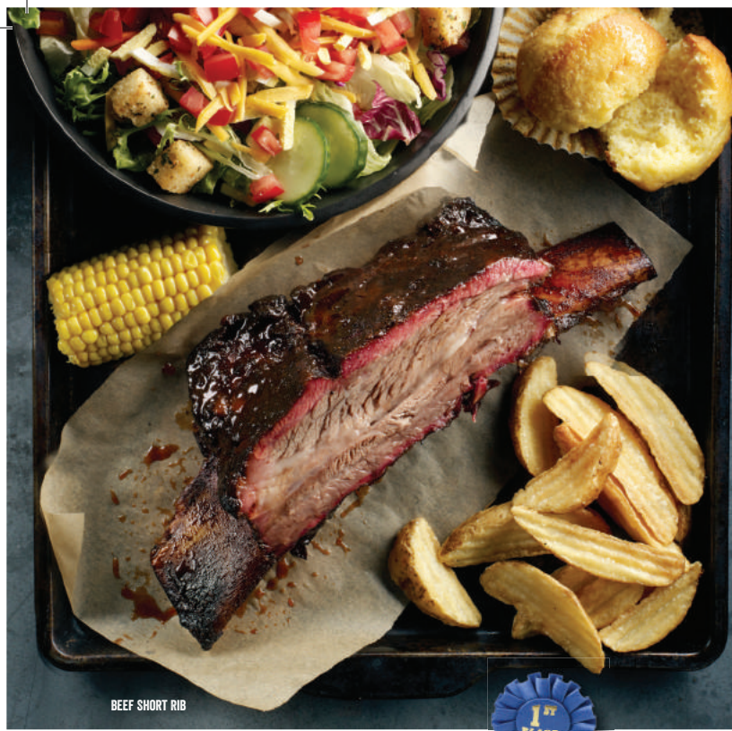
BEEF SHORT RIB