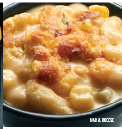
MAC & CHEESE